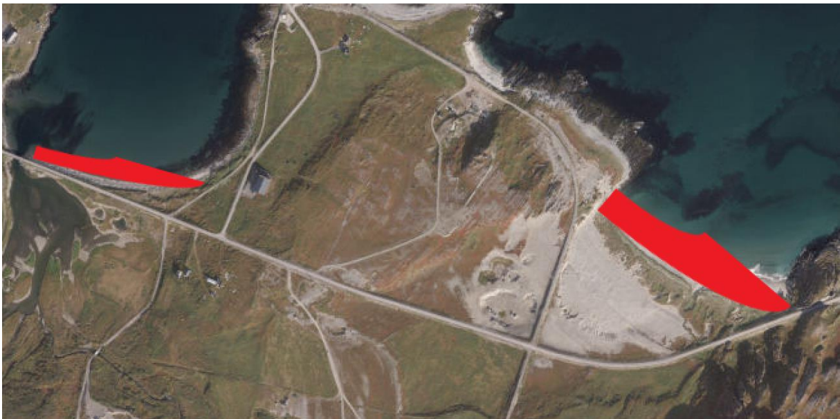
Figur 5 - Strandområder. Storsanden til høyre

Strendene brukes om sommeren, helst i forbindelse med godt vær og høye temperaturer. Dette skjer ikke ofte, og man kan ikke si at det er særlig mye bruk av strendene.