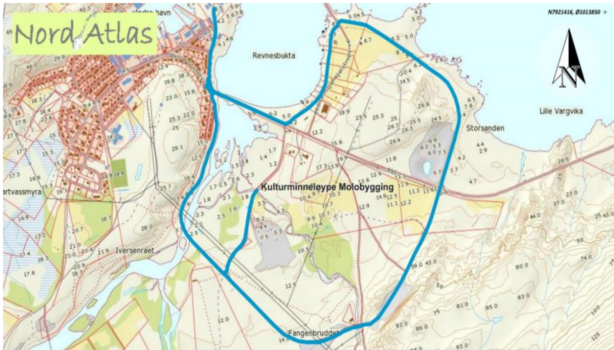
Figur 4 - Kulturminneløype.

Langs løypa er det satt opp informasjonsskilt som viser hvilke aktiviteter som pågikk langs løypa. Mesteparten av aktiviteten skjer om sommeren, men store deler av løypa er også tilgjengelig om vinteren.