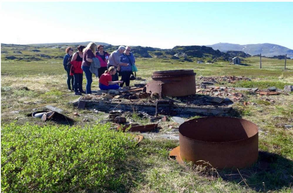
Befaring i Russerfangeleiren.