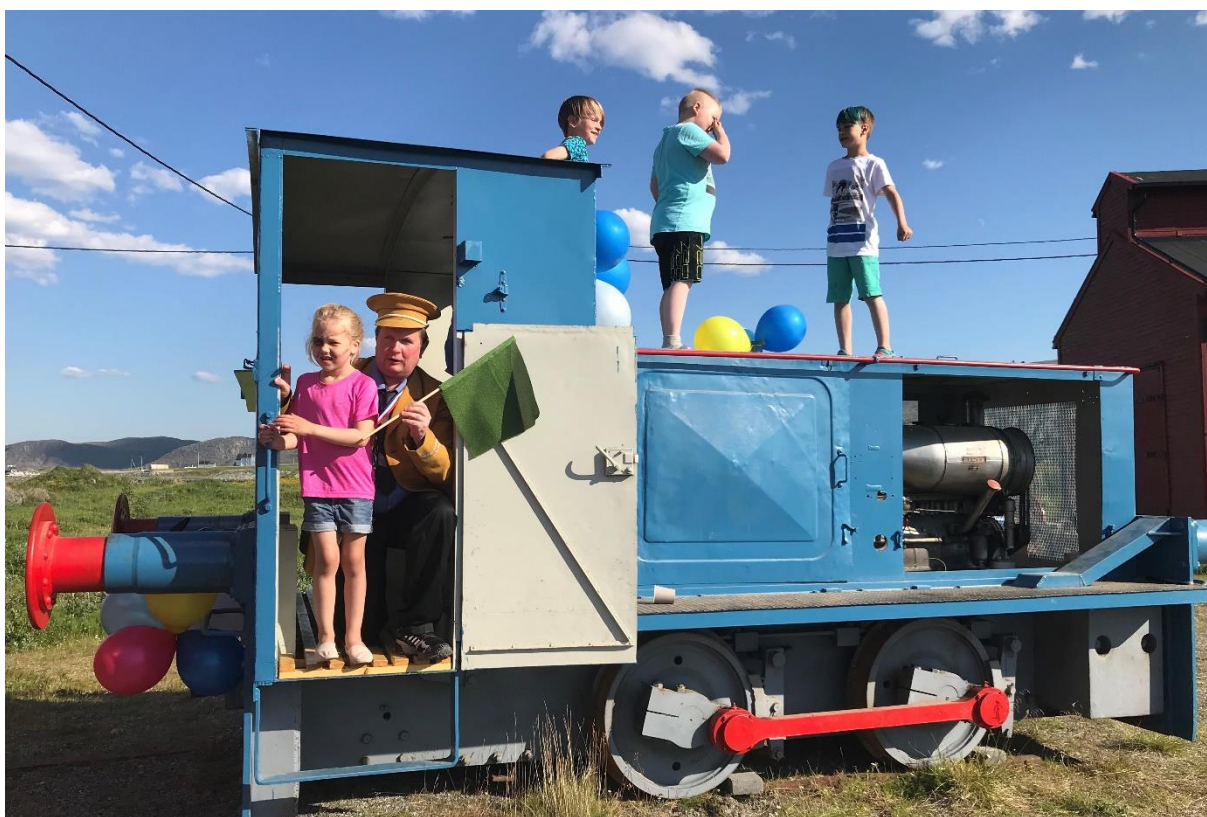
Barnas dag 2018.