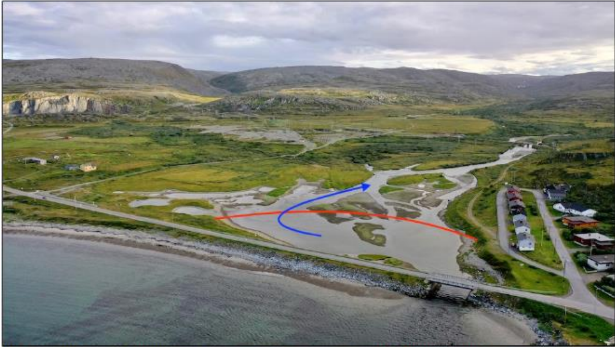
Rød pil - BJFF forslag. Blå pil viser oppgang av anadrom fisk utenfor flomperioden i juli og august.