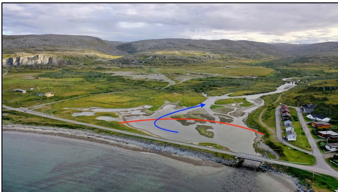
Rød pil - BJFF forslag. Blå pil viser oppgang av anadrom fisk utenfor flomperioden i juli og august.

Utbygger, entreprenør og konsulent vil altså legge den aktuelle vannledning som vist på bildet, nær Storelvbroa. Vår kunnskap om området tilsier at grøfting da vil krysse området hvor vi vet laks og sjørøye står ved flo sjø. Like ved på nordsiden er det åpent fjell i elvebunnen og ståplass for fisk også på fjæra sjø. Sannsynligheten er derfor svært stor at den tenkte trase vil treffe fjell i bunnen og medføre sprenging. BJFF har derfor foreslått å legge kryssingen lengre opp i dammen og i de store elve- og morenemasser som ligger her. Man vil sannsynligvis unngå sprenging i fjell her.