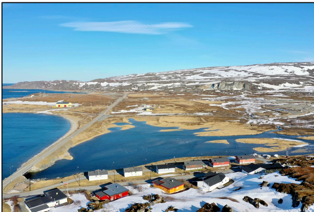
Elvemunning og delta i Storelva ved flo sjø. Munningsområdet er også tilvenningsområde for både laks og sjørøye før oppgang.

BJFF har derfor vært imøtekommende og gitt innspill på vårt forslag som trolig vil ha betydelig mindre skadevirkninger i vassdraget. Vi vil her igjen påpeke at anleggsvirksomhet og grøftelegging er svært risikabelt i et såpass viktig område av vassdraget. Munningsområdet her med vekslende av fersk- og sjøvann/ flo og fjære, er et område man vet er viktig for både laks og sjørøye, både på oppgang før gyting, senere etter gyting og tilslutt matsøk for sjørøya på våren og forsommeren.