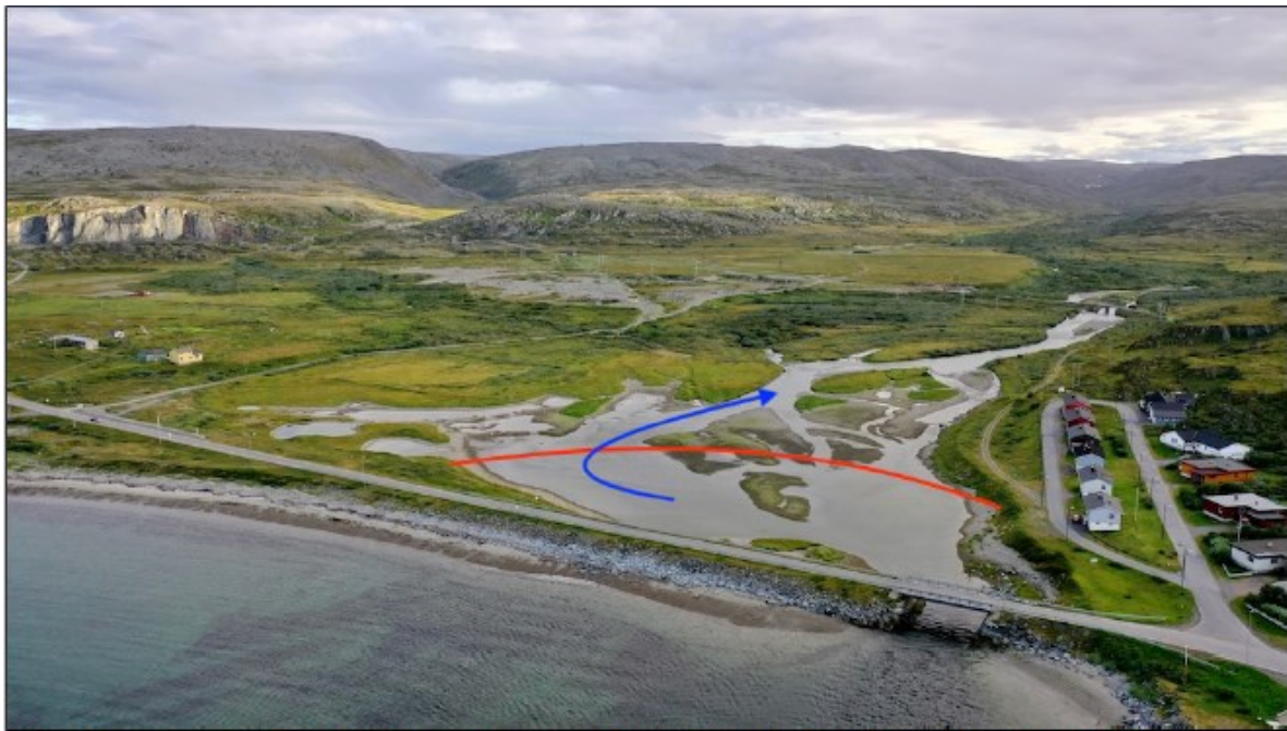
Rød pil - BJFF forslag. Blå pil viser oppgang av anadrom fisk utenfor flomperioden i juli og august.