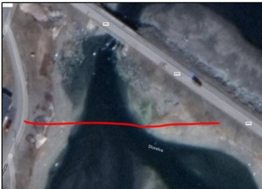
Forslag fra Berlevåg kommune/ utbygger

Utbygger, entreprenør og konsulent vil altså legge den aktuelle vannledning som vist på bildet, nær Storelvbroa. Vår kunnskap om området tilsier at grøfting da vil krysse området hvor vi vet laks og sjørøye står ved flo sjø. Like ved på nordsiden er det åpent fjell i elvebunnen og ståplass for fisk også på fjæra sjø. Sannsynligheten er derfor svært stor at den tenkte trase vil treffe fjell i bunnen og medføre sprenging. BJFF har derfor foreslått å legge kryssingen lengre opp i dammen og i de store elve- og morenemasser som ligger her. Man vil sannsynligvis unngå sprenging i fjell her.