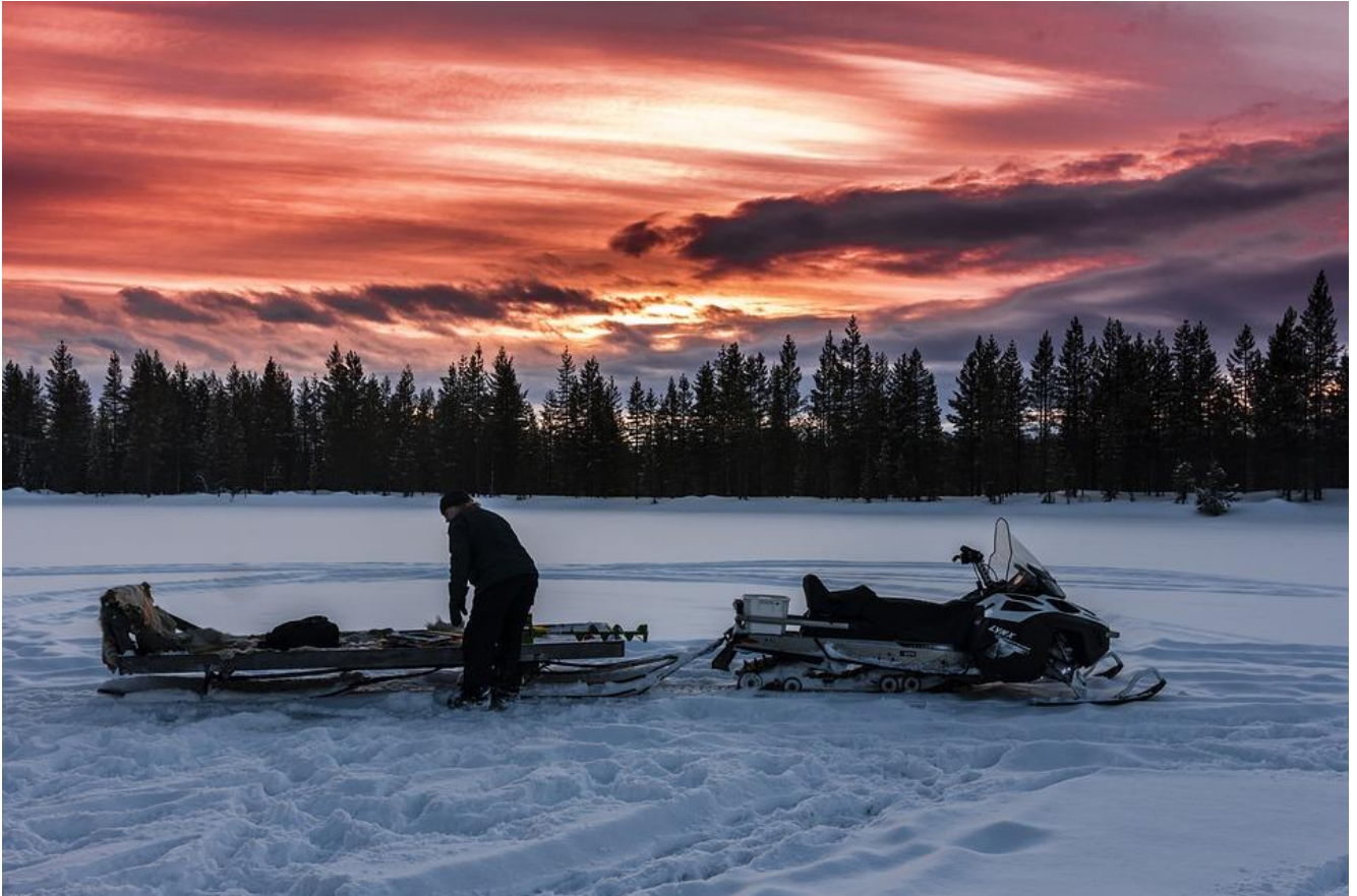
Bilde 1: Snøskuterkjøring.