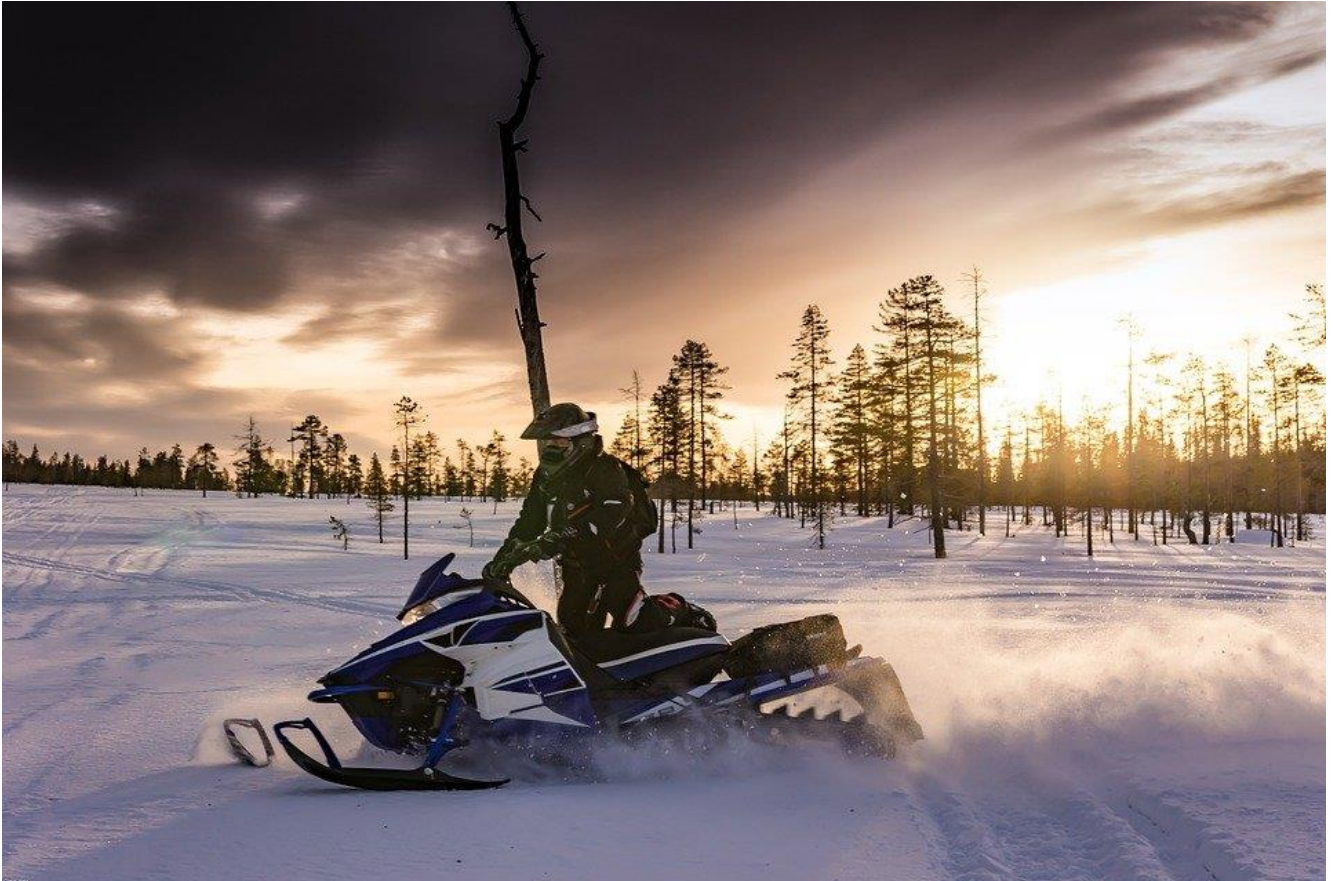
Figur 1: Snøskuterkjøring.

En renummerering av løypetallene er inkludert i nye løyper, slik som løype 16. Her er løype 16 den største endringen i nye løyper, der de andre er mindre og kan regnes som sideløyper og avstikkere med egne løypetall. De fleste av disse sideløypene er eksisterende løyper, med unntak av løype 17 og 18. En annen endring er at tidligere løype 6 gjennom Langdalen er stengt på grunn av rasfare. Løype 5 kan brukes istedenfor Langdalen der dette er mulig og været tillater dette.